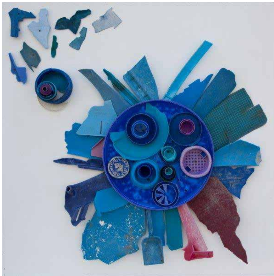
IL VENTO FA IL SUO GIRO N° 1 2014, MIXED WASTE (PLASTIC) REJECTED BY THE SEA, WATERCOLOR ON WOOD, 101X101 CM