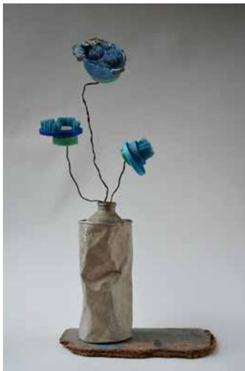
LES BLEUETS MIXED WASTE (WOOD, PLASTIC AND METAL) REJECTED BY THE SEA, 2015, 20X10X50 CM (SCULPTURE)