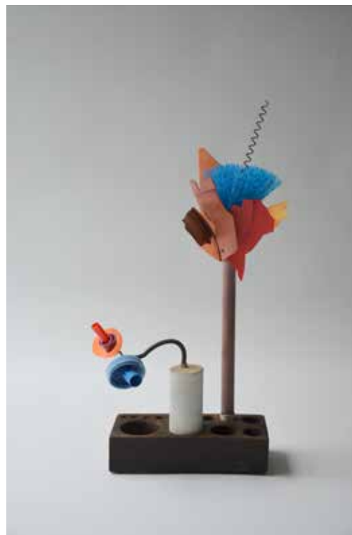
DUE PESI, DUE MISURE MIXED WASTE (WOOD, PLASTIC AND METAL) REJECTED BY THE SEA 2016, 20X10X50 CM (SCULPTURE)