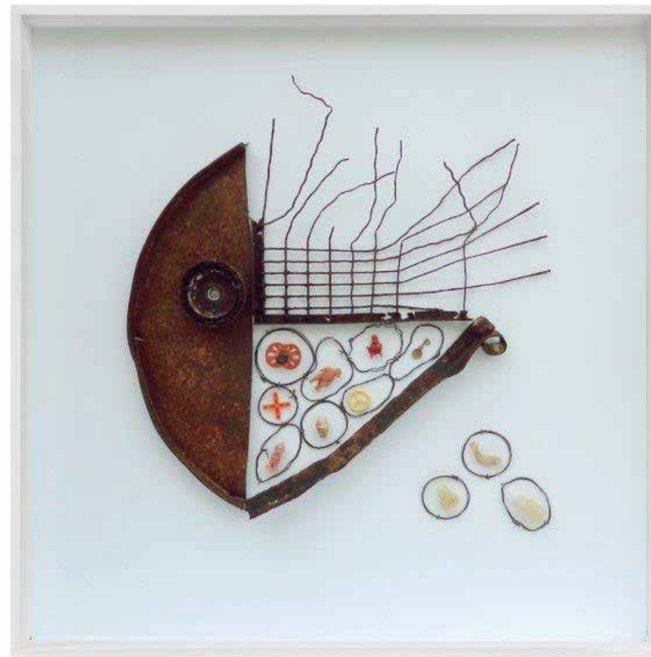
BRASSAGE PLANETAIRE (MESCOLANZA PLANETARIA) 2016, MIXED WASTE (PLASTIC, RUBBER AND METAL) REJECTED BY THE SEA, WATERCOLOR ON WOOD, 92X92 CM