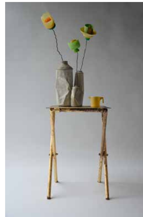
LE PETIT DEJEUNER N°1 MIXED WASTE (PLASTIC AND METAL) REJECTED BY THE SEA, IRON TABLE, GOLD LEAVES 2016, 30X30X75 CM (SCULPTURE)