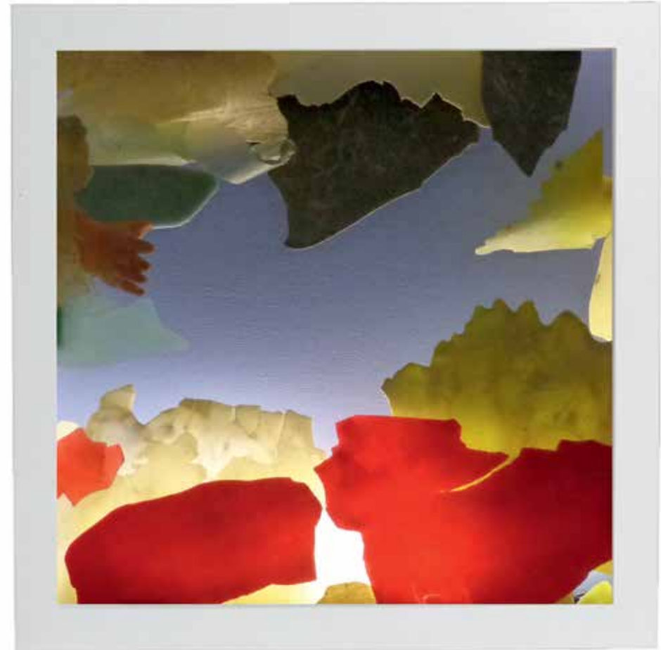
LIGHTING SKY N°3 / NUVOLE, ALL'AURORA

2016, MIXED WASTE (PLASTIC, RUBBER AND METAL) REJECTED BY THE SEA, WATERCOLOR ON WOOD, 92X92 CM