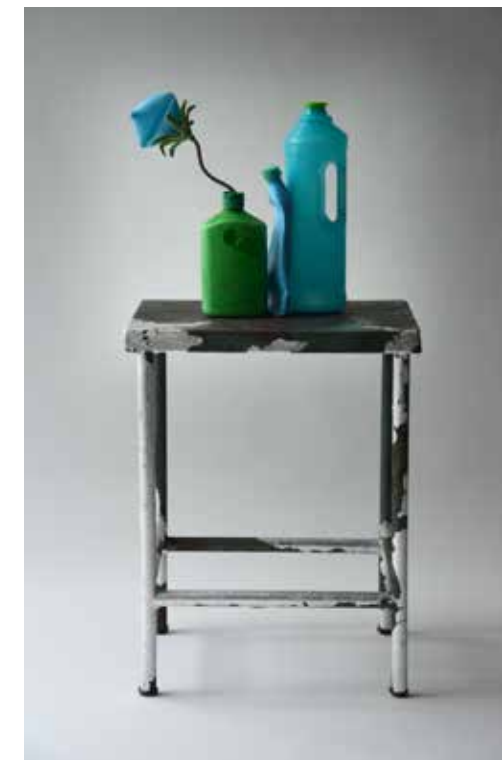
LE PETIT DEJEUNER N°2 MIXED WASTE (PLASTIC AND METAL) REJECTED BY THE SEA, IRON TABLE, SILVER LEAVES 2016, 35X30X70 CM (SCULPTURE)