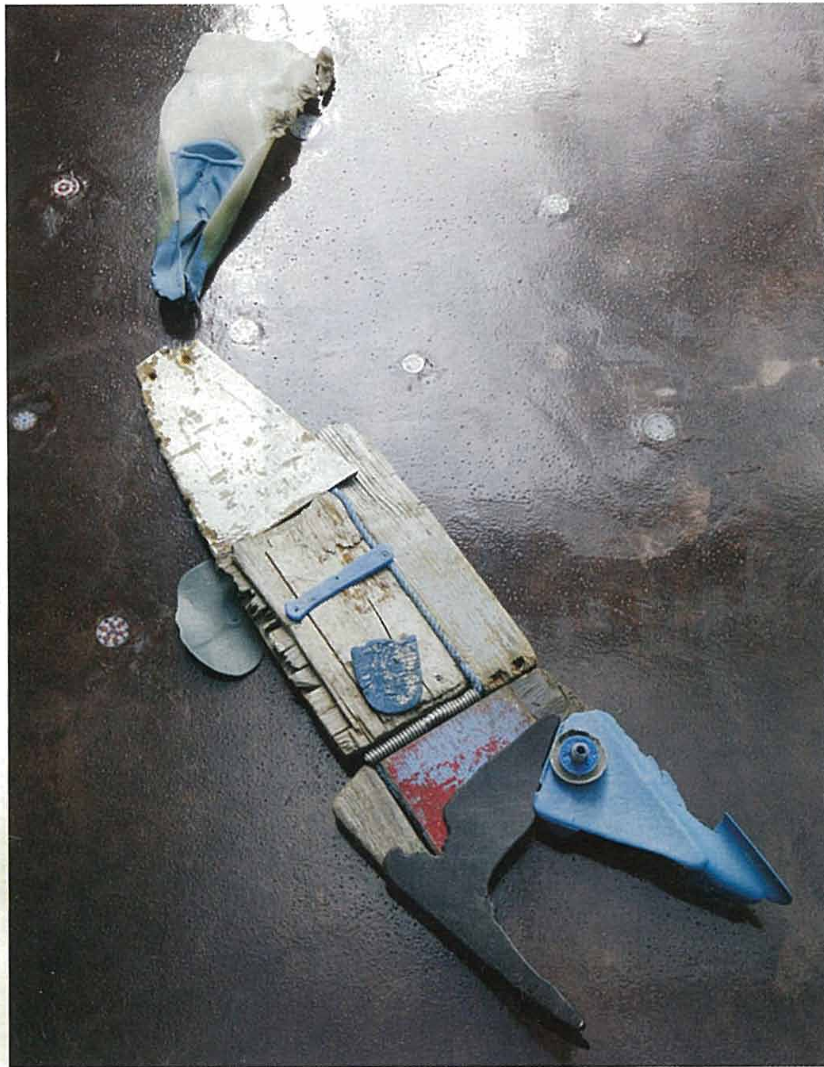
Marillina Fortuna, Colpo di vita (cm 60x160 h), 2007, mixed media, fa parte della Junk collection realizzata con 'scarti' raccolti sulla battigia.